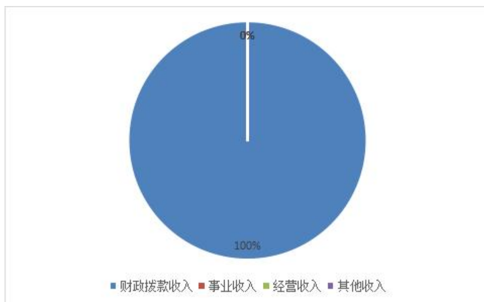
图 1.收入决算图（以饼图列示）